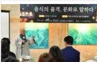
남도음식 진흥 세미나