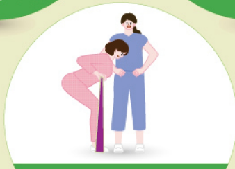
근골격계 질환 예방 운동 교육