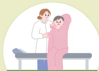
당일 의사 진찰 및 상담