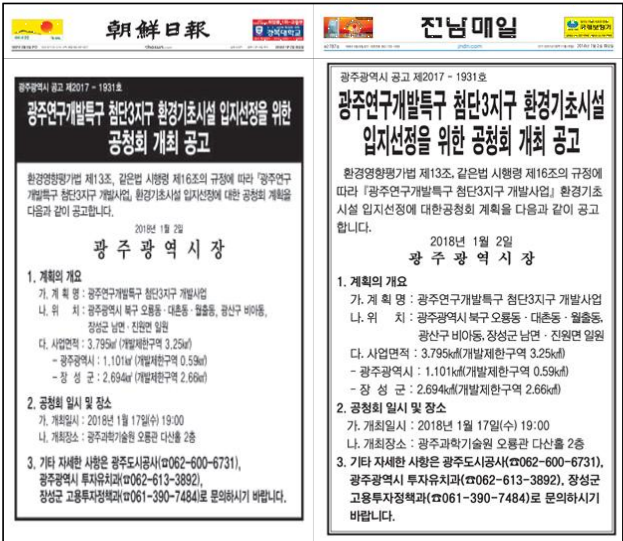
(그림 7) 공청회 신문공고