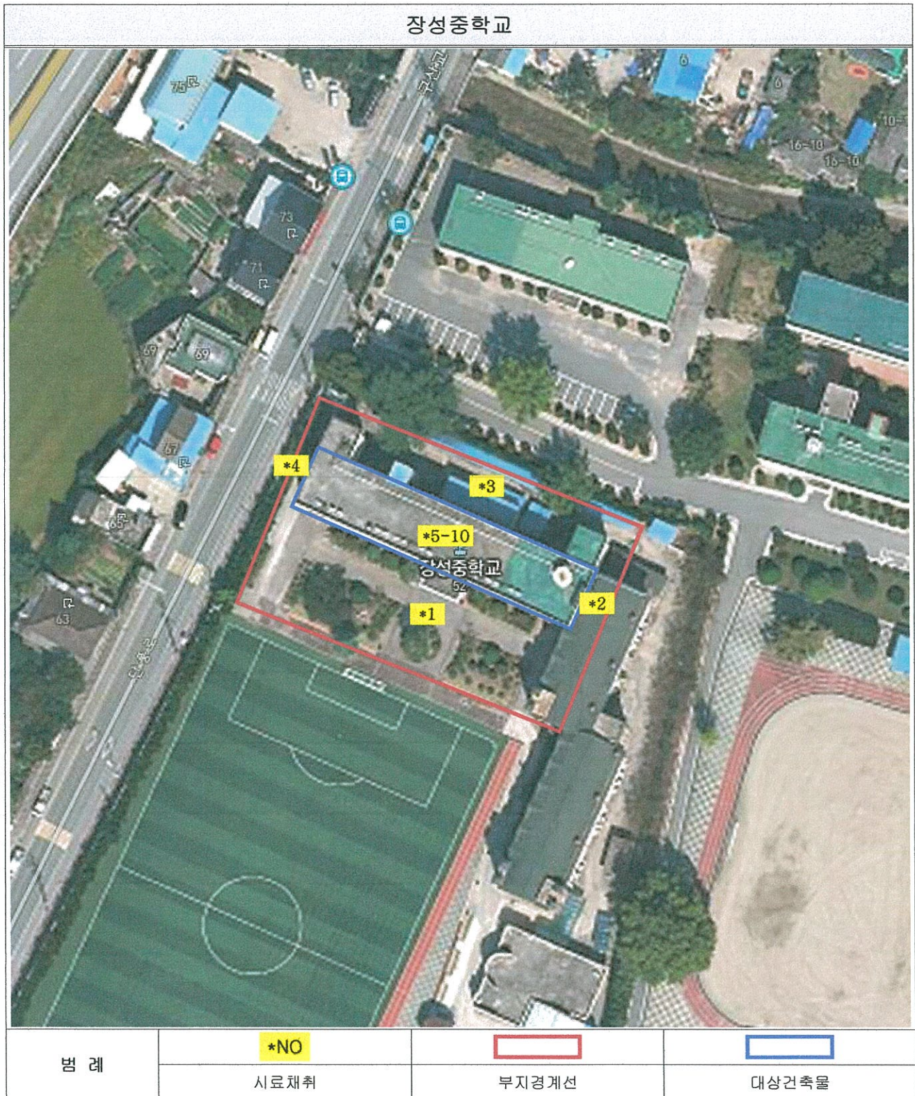
[별첨1] 측정 위치도(측정 장소)