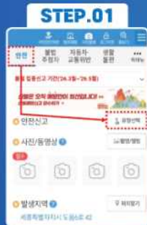
안전신문고앱 실행 안전신고 메뉴 > 유형 선택