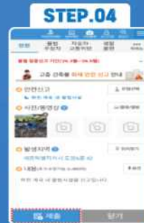
사진·동영상 첨부 후 제출