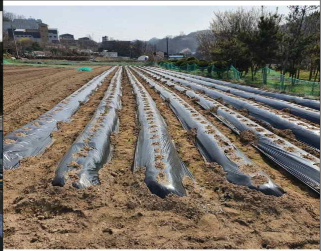
멀칭비닐(모든색상 수거 가능)