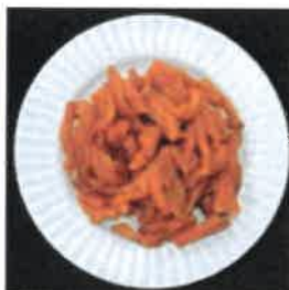
〈말랭이 특성 우수〉