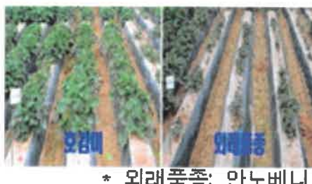
* 외래품종: 안노베니 〈덩굴쪄김병 발생 포장〉