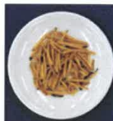
〈스틱 특성 우수〉