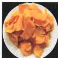
〈찹 특성 우수〉