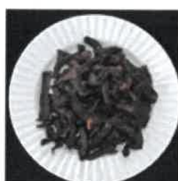
〈말랭이 특성 우수〉