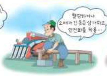
작업시 적합한 복장