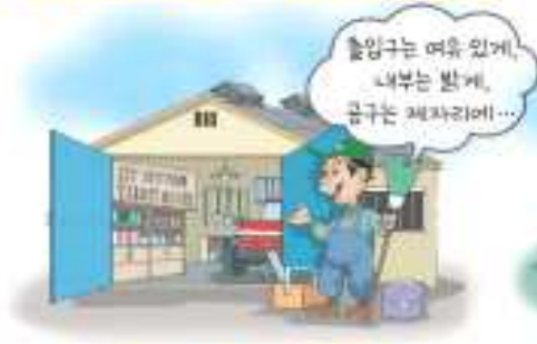
농업기계 보관창고는 항상 정리정돈