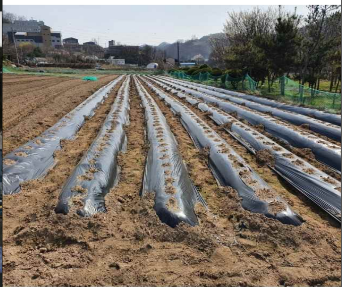
멀칭비닐(모든색상 수거 가능)