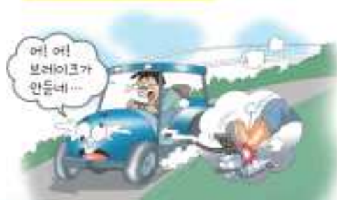
운전석 주변 항상 청결