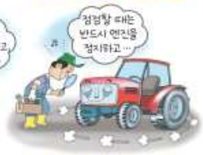
점검시 반드시 엔진정지