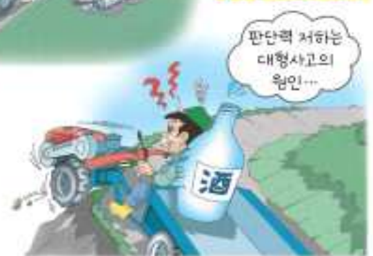
음주운전 절대 금지