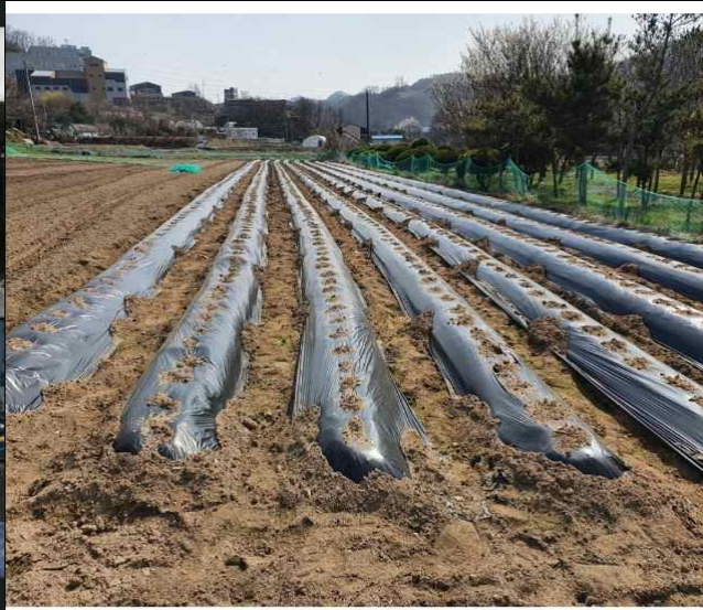
멀칭비닐(모든색상 수거 가능)