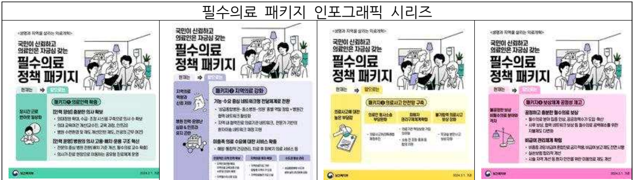
필수의료 패키지 인포그래픽 시리즈