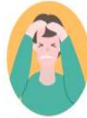
갑작스런 심한 두통