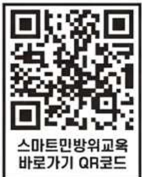
스마트민방위교육 바로가기 QR코드