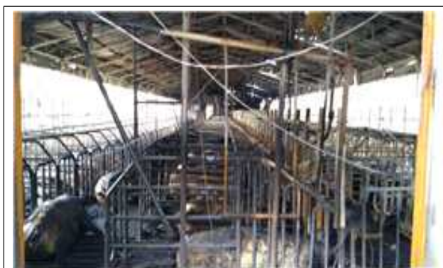
환풍기 과열에 의한 화재