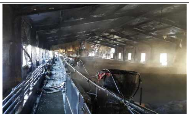
전기 절연불량에 의한 화재