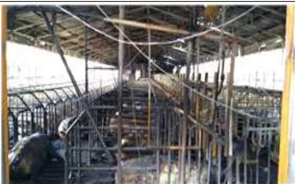
환풍기 과열에 의한 화재