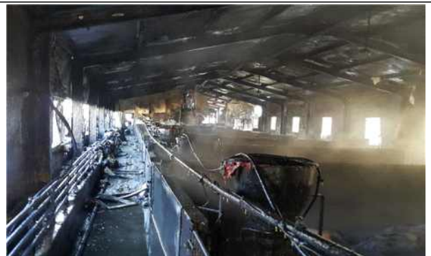
전기 절연불량에 의한 화재