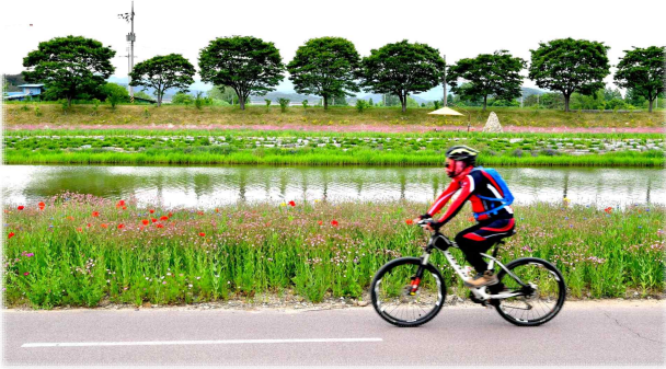
황룡강 자전거 도로