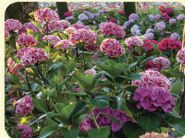
수국 (변덕, 진심, 소녀의 꿈)