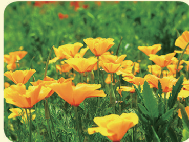
금영화 (꽃말: 희망)