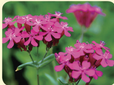
끈끈이대나물 (꽃말: 청춘의 사랑)