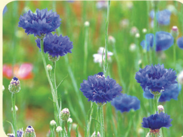
수레국화 (꽃말: 미모, 가냘픔)