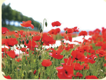
양귀비 레드 (꽃말: 위안)