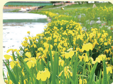
노란꽃창포 (꽃말: 우아한 마음)