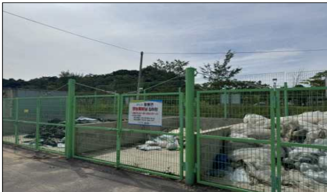
시설관리 우수 사례(황룡면)