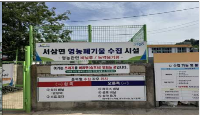
시설관리 우수 사례(서삼면)