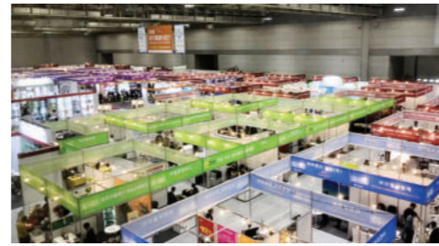
• 전시장 전경

후원 농림축산식품부, 전라남도, 광주지방식품의약품안전청, 한국외식업중앙회 광주지회, 한국식품산업협회, 대한제과협회 광주지회, 한국조리사협회중앙회 광주전남지회, 한국프랜차이즈산업협회 광주전남지회