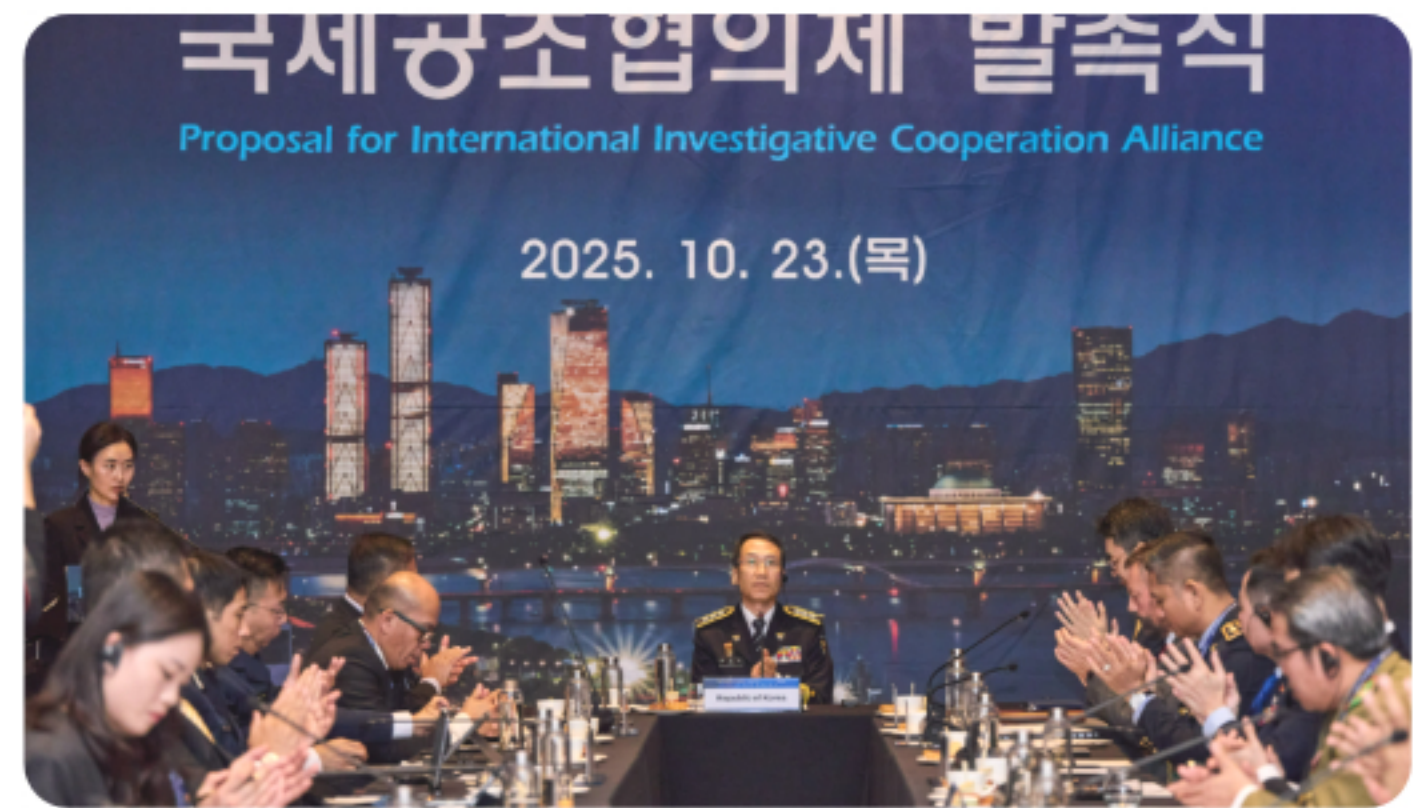
글로벌 치안 연대 조성