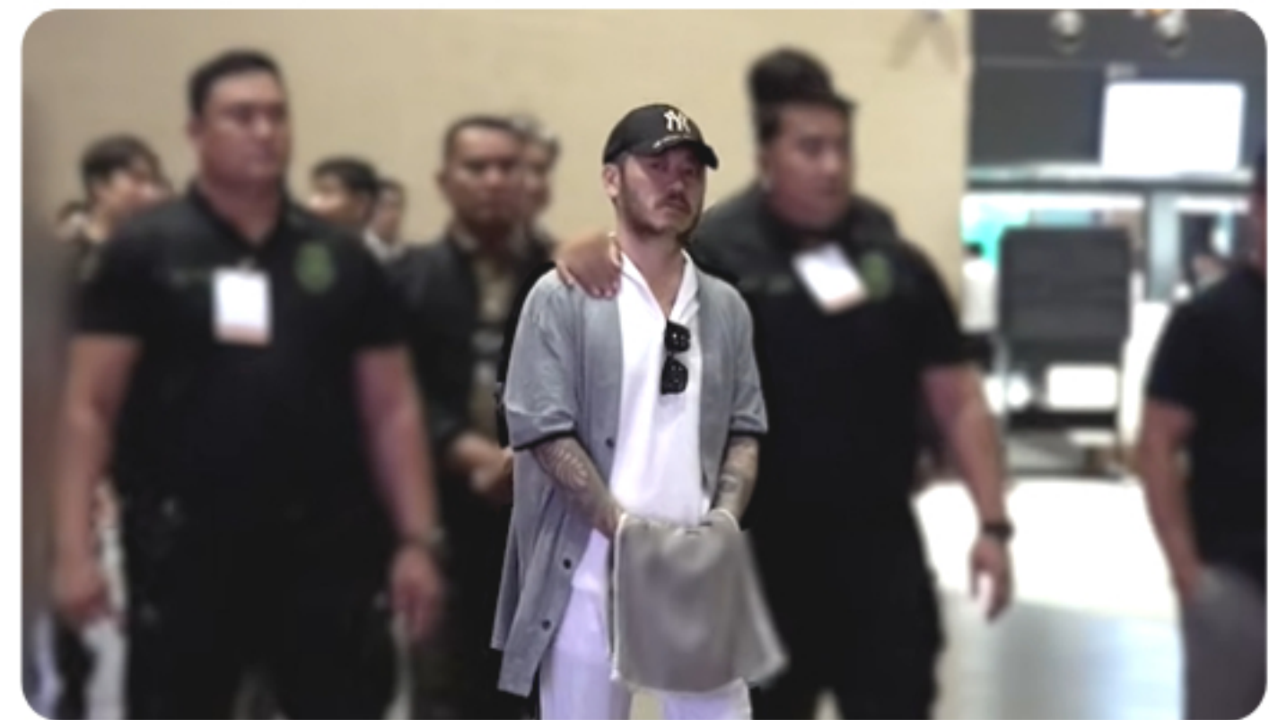
마약왕 등 도피사범 송환