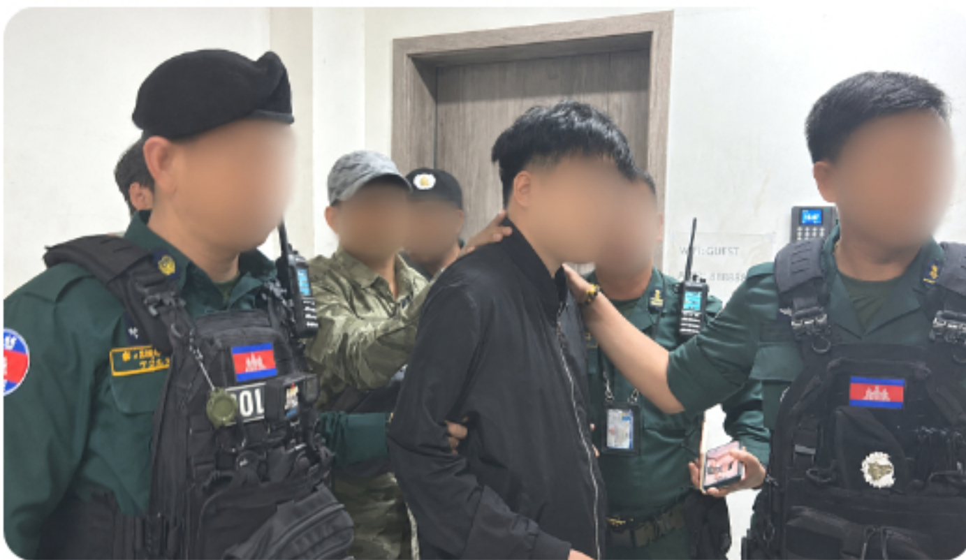
현지 경찰과의 공조 작전