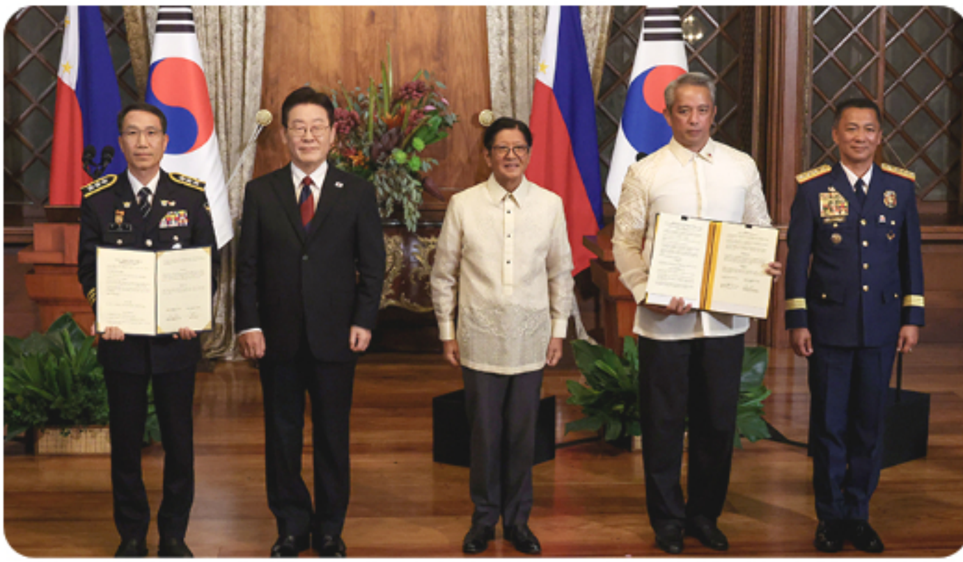
치안분야 외교 의제화