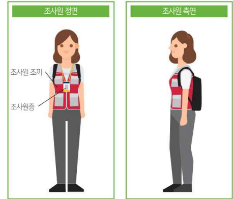
< 조사원 복장 >