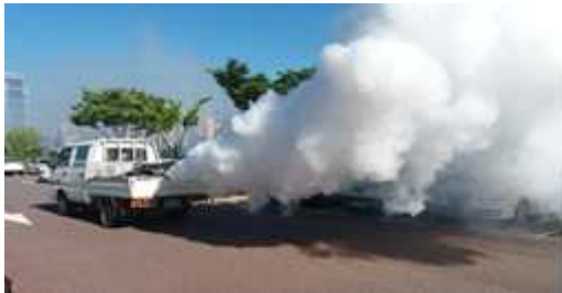
【 기존 : 연막 】