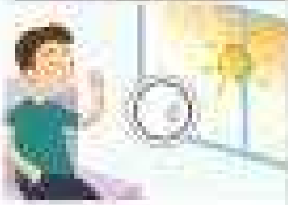
3. The boy is sitting at his desk and looking at the screen.