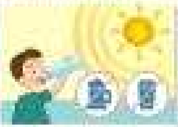
2. The boy is standing in the room.