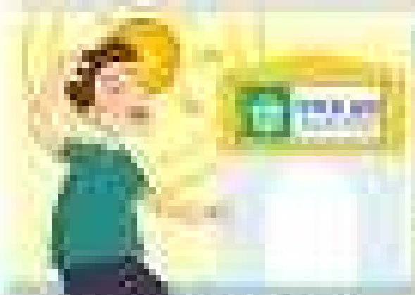
5. The boy is sitting at his desk and looking at the screen.