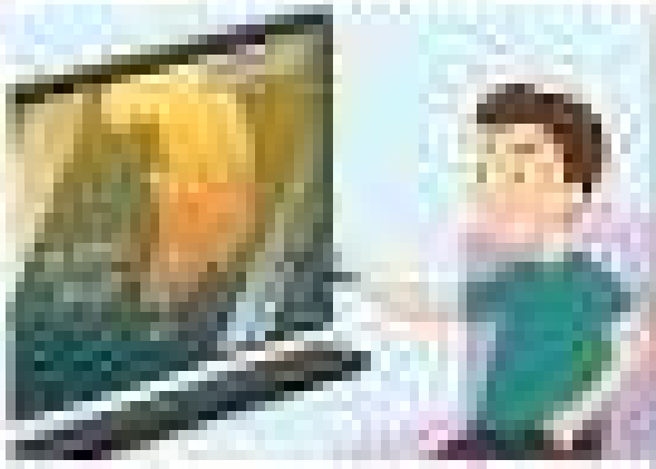
1. The boy is sitting at his desk.