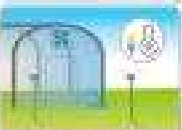
6. The boy is standing in the field.