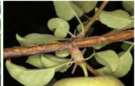
(사과나무 산란 피해 >