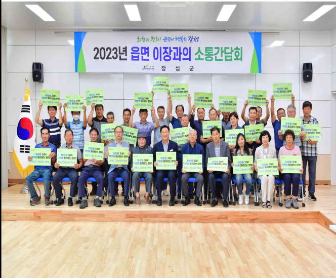
'23.7.17. 북이면 이장단 고향사랑기부제 참여 홍보