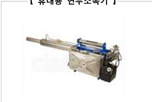
【 휴대용 연무소독기 】