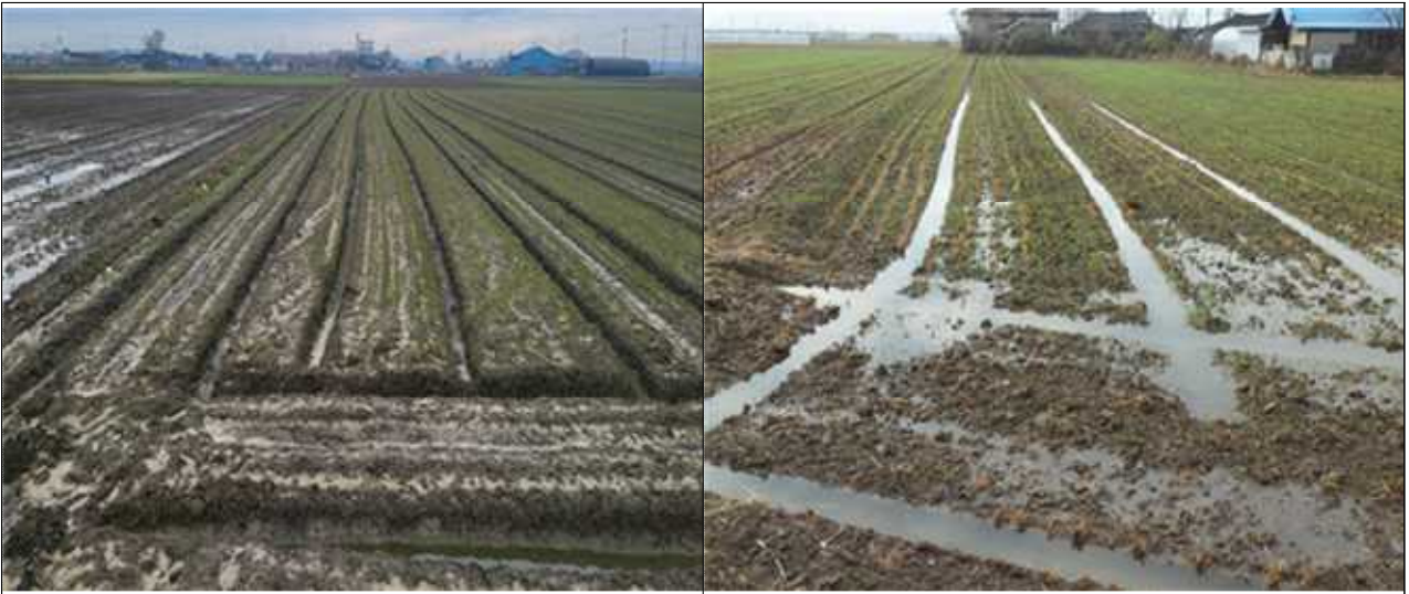
배수로 정비 불량으로 인한 습해 발생