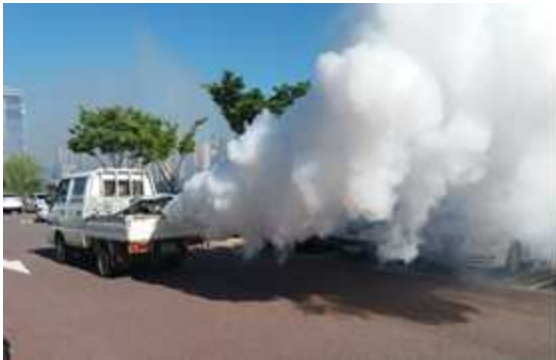
【 기존 : 연막 】