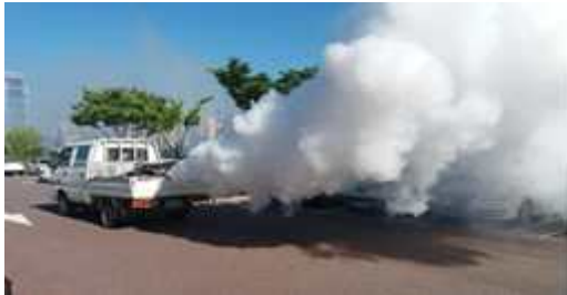
【 기존 : 연막 】