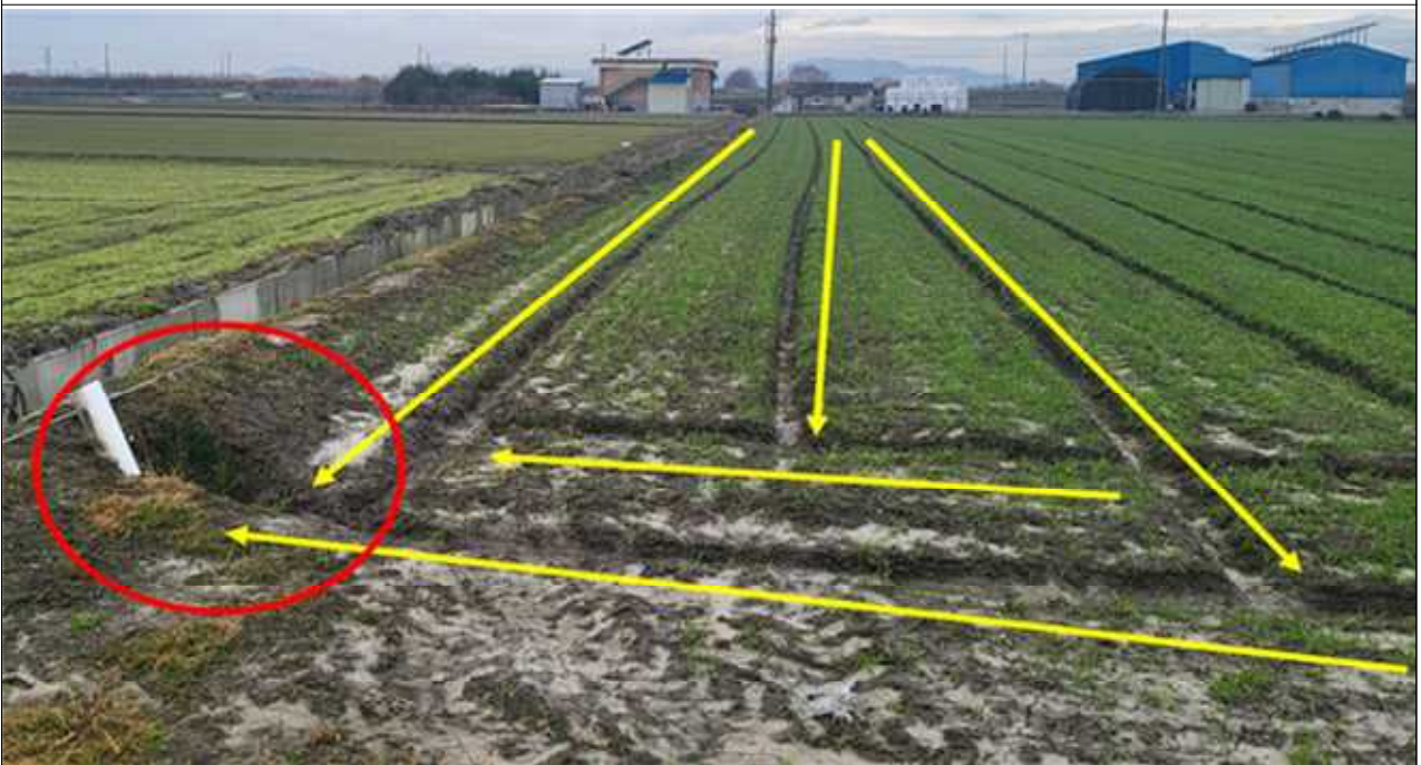
배수로 정비로 습해 예방