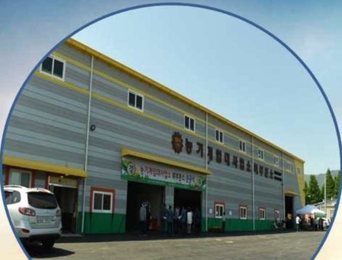
농기계임대사업소 북부분소(북이면) (2017년 5월 개소)