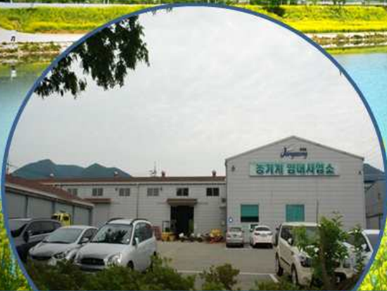
농기계임대사업소 본소(기술센터) (2009년 8월 개소)