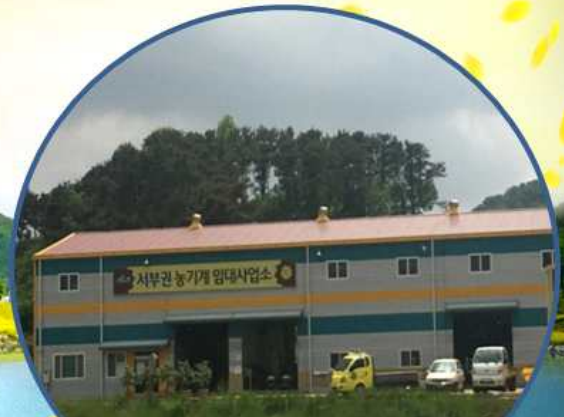
농기계임대사업소 서부분소(삼계면) (2016년 3월 개소)